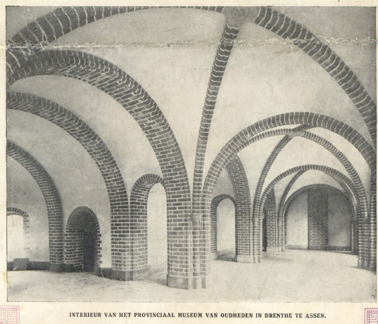
INTERIEUR VAN HET PROVINCIAAL MUSEUM VAN OUDHEDEN IN DRENTHE TE ASSEN.