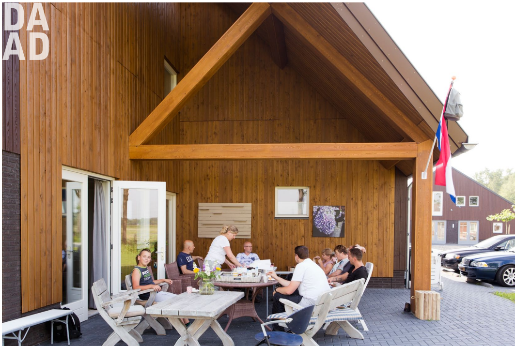
Het woongebouw heeft een verbijzondering aan de straatzijde met een overdekte buitenruimte.