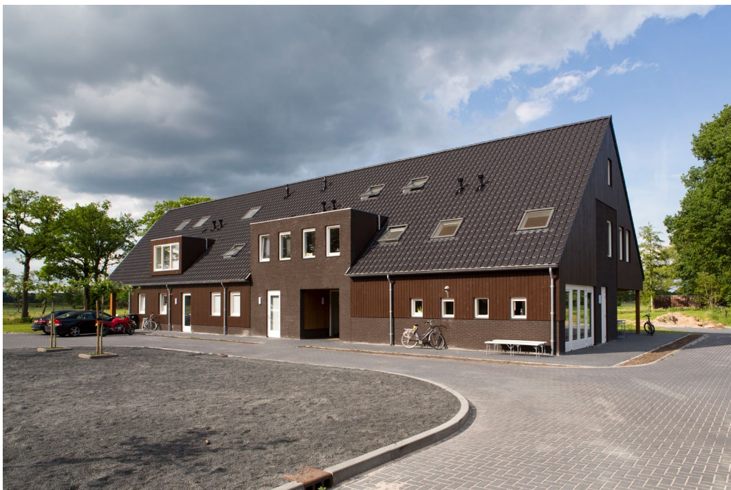
Het woongebouw met een gevel als nuchtere vertaling van de achterliggende functies.

Het woonhuis vormt de nieuwe drager van het nieuwe erf. Het onderscheidt zich in maat en schaal, met een verbijzondering aan de kop van het gebouw naar de straat. In het woongebouw zijn de buitenruimten integraal in het ontwerp meeontworpen.