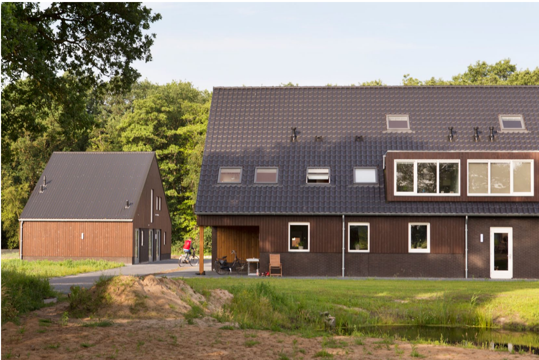
Baksteen en hout in gedekte natuurlijke kleuren, passend in de omgeving