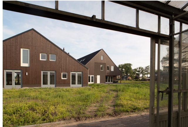
Zicht vanuit de kassen die worden hergebruikt.

Net buiten Hoogeveen, aan de Stuifzandseweg is Zorgerf 'De Vliager' gerealiseerd. Deze woon- en werk-gemeenschap is bestemd voor mensen met een Autisme Spectrum Stoornis (ASS) al dan niet in combinatie met een verstandelijke beperking. De particuliere initiatiefnemers hebben zelf een kind met ASS en willen voor deze doelgroep een passende woon-werkplek creëren. Samen met de gemeente Hoogeveen is gezocht naar een passende locatie. Deze is gevonden op de plek van een voormalige kwekerij. Met een streekeigen ontwerpconcept voor erf en gebouw is aangetoond dat een zorgvuldige analyse en inpassing in de omgeving een positieve bijdrage levert aan de bewoners en het zorgbedrijf, maar ook de ruimtelijke kwaliteit van het gebied vergroot. Dit zorgerf levert een positieve bijdrage aan de leefbaarheid van het buitengebied van Hoogeveen.