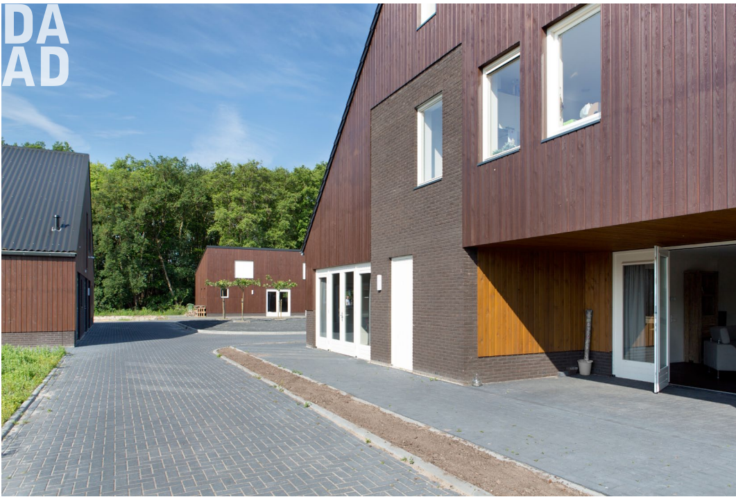
Zicht op het erf en de veranda van de gezamenlijk woonkamer