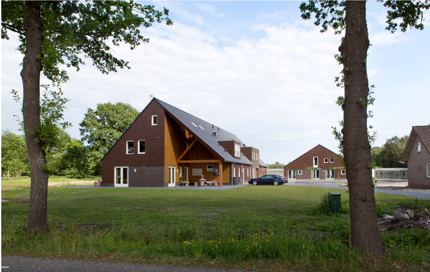
Duidelijk erfprincipe. Links het nieuwe hoofdgebouw met begeleiderswoning, appartementen en collectieve functies.