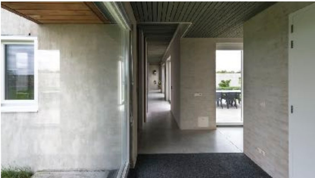
entree en woonvleugel