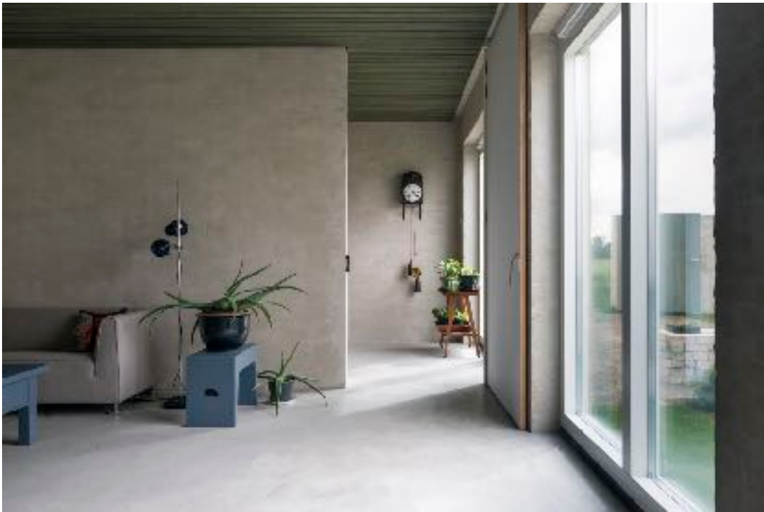
woonkamer met patio-tuin