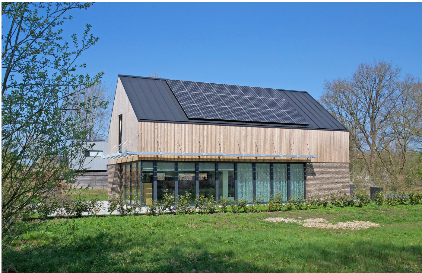
Aanzicht vanuit het zuid-westen.