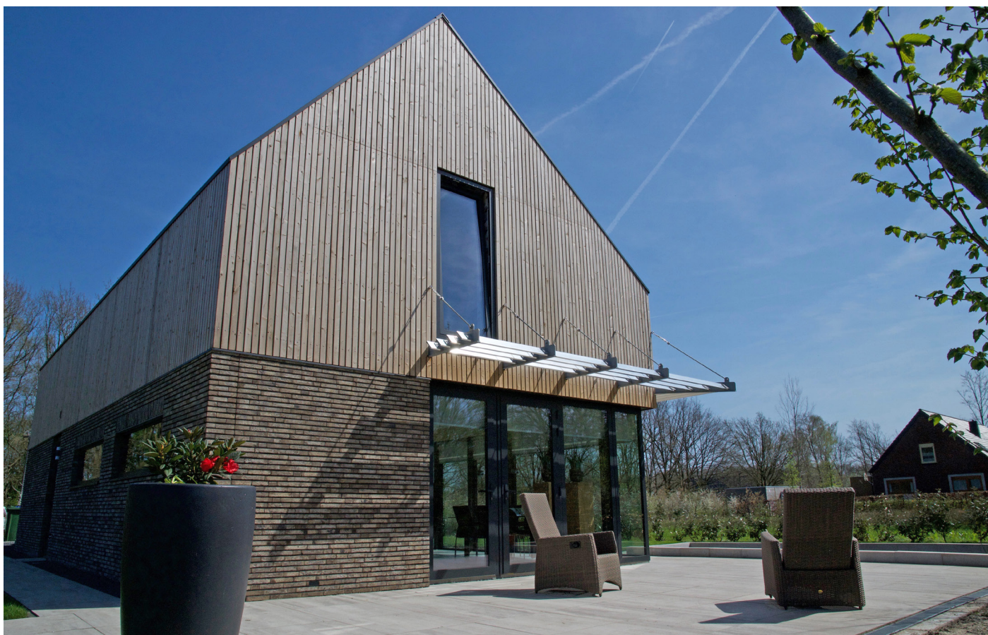
Aanzicht vanuit het noord-westen.