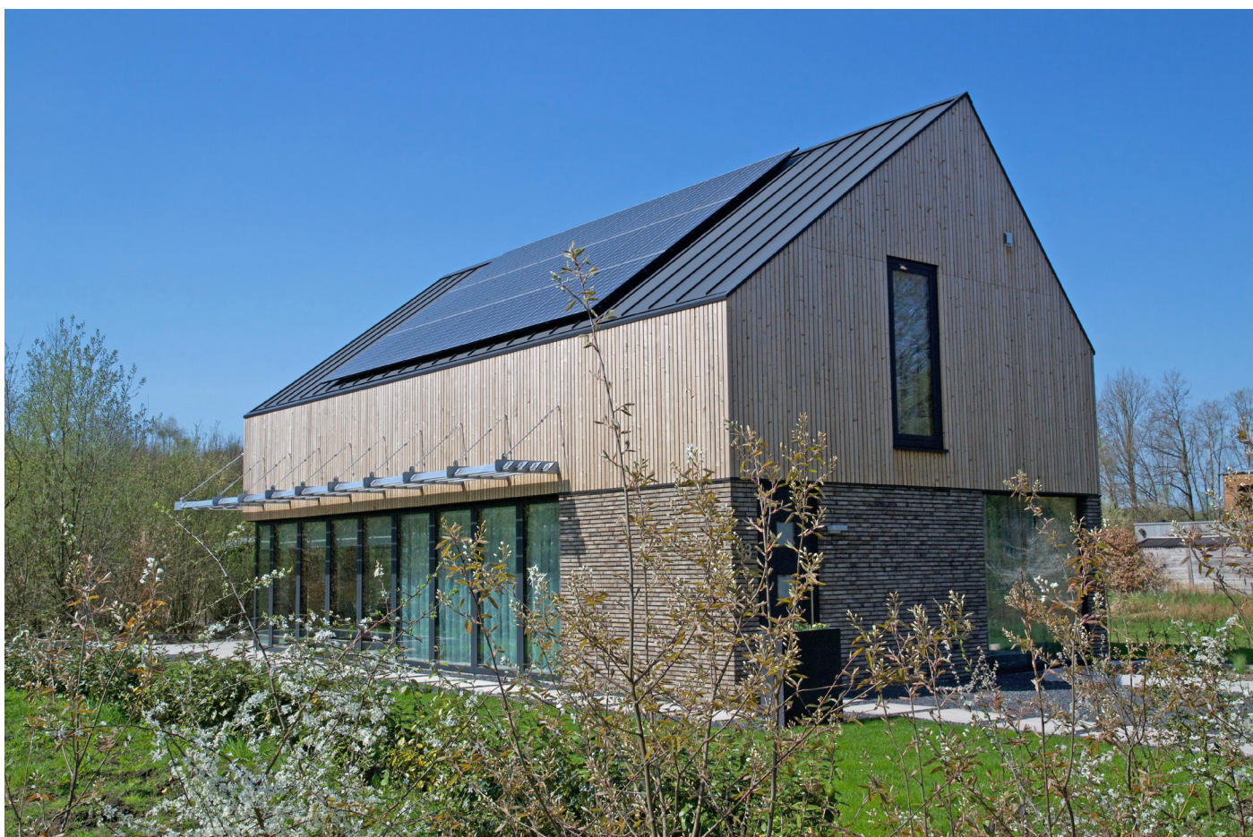
Aanzicht vanuit het zuid-oosten (straatzijde).