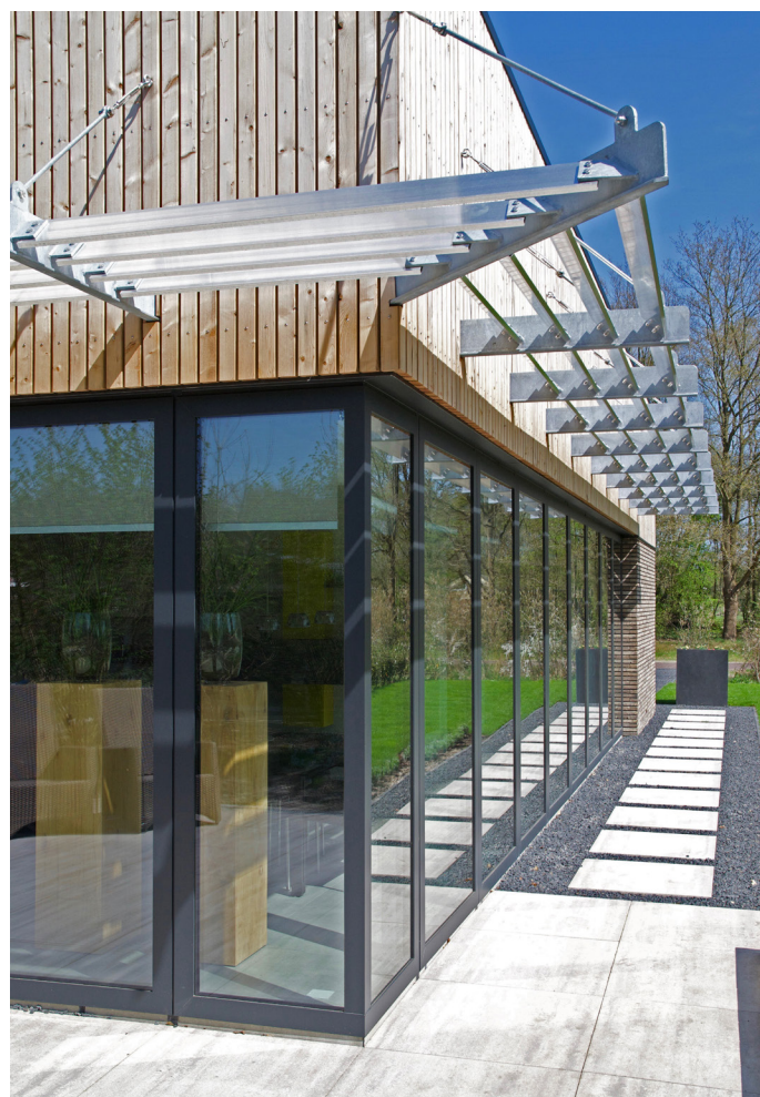
Details metselwerk, houten gevelbekleding en zonwering.