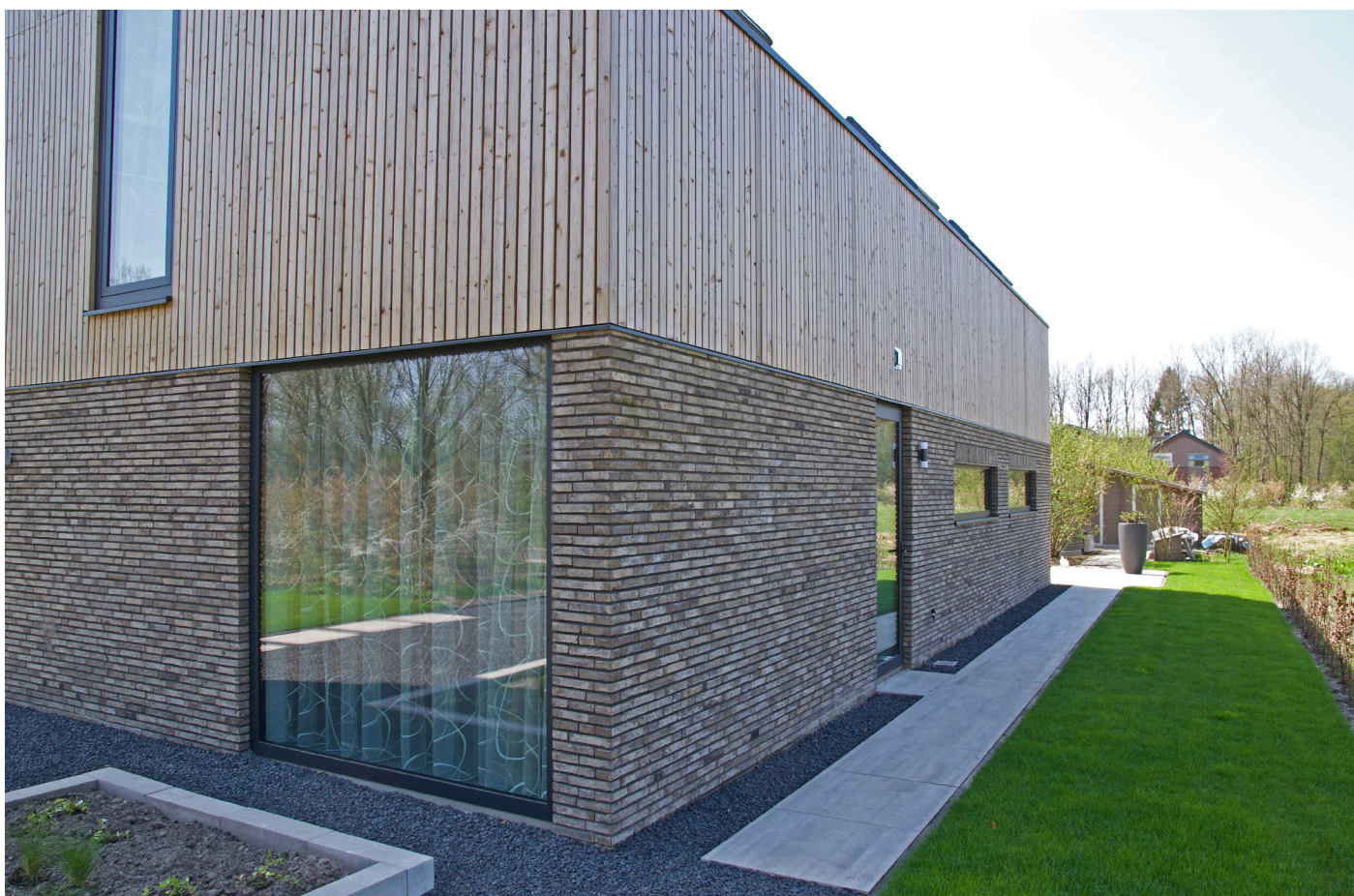
Aanzicht vanuit het noord-oosten (straatzijde).