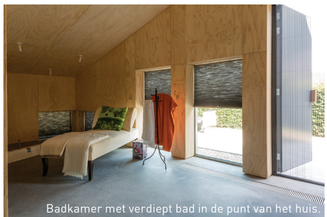
Badkamer met verdiept bad in de punt van het huis.

'Aan de voorkant is het een keuken, aan de achterkant is het een badkamer. Ik heb het bad verzonken in de grond zodat je in het bad afdaalt en de ruimte vanuit het bad als groter kunt ervaren. De ramen en deuren kunnen open en vanuit het bad kijk je zo diagonaal door het huis.'