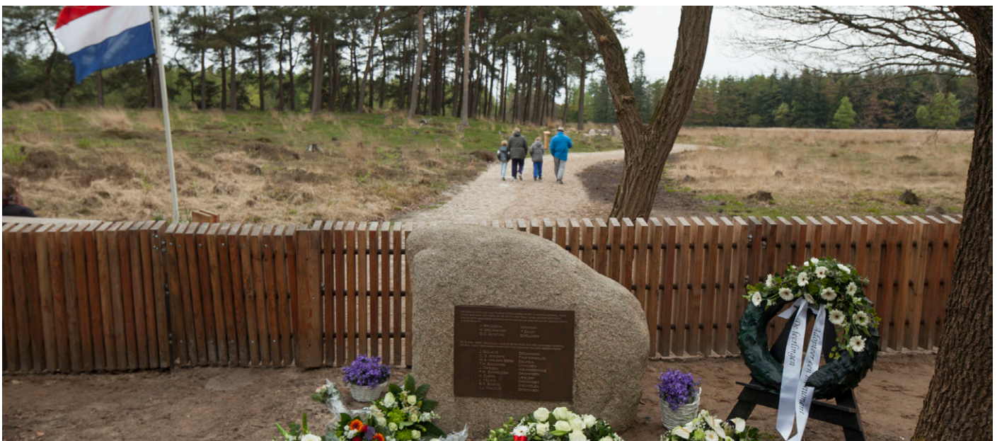
Herdenking tijdens 4 mei bij het vernieuwde monument