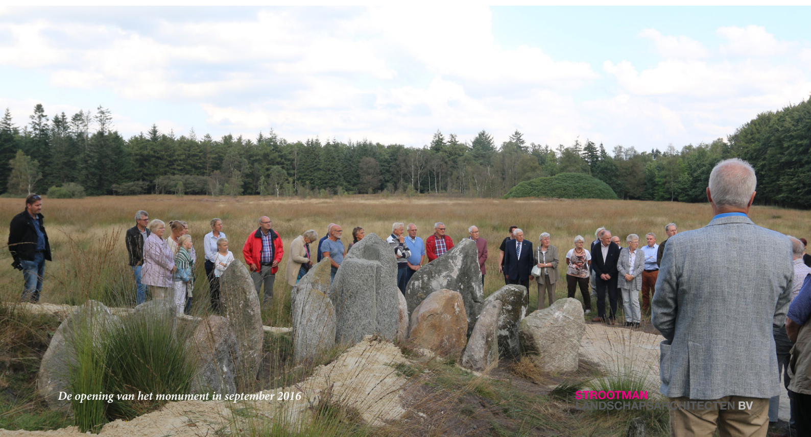
De opening van het monument in september 2016

Er wordt een informeel pad aangelegd dat opgaat in het landschap. Het pad bestaat uit veldkeien die onregelmatig verspreid worden neergelegd, zodat ze naar buiten toe "uitwaaiëren". De bestaande aarden rand van het onderduikershol wordt aan de buitenkant verstevigd en wat opgehoogd met aarde, afkomstig uit het gebied. In de ingang van het hol komen 13 mens-grote, veldkeien te staan die de 13 omgekomen mensen symboliseren.