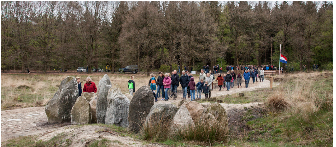
Herdenking tijdens 4 mei bij het vernieuwde monument