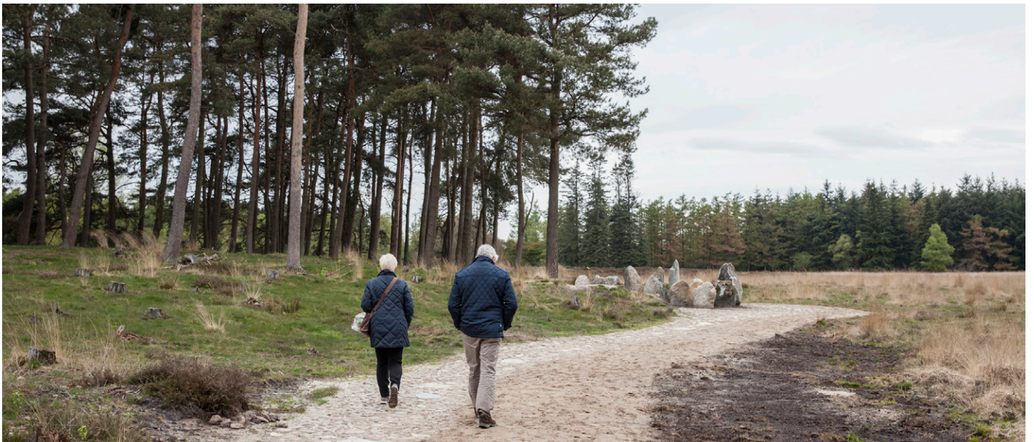
Het pad bestaat uit veldkeien die onregelmatig verspreid worden neergelegd, zodat ze naar buiten toe "uitwaaieren".