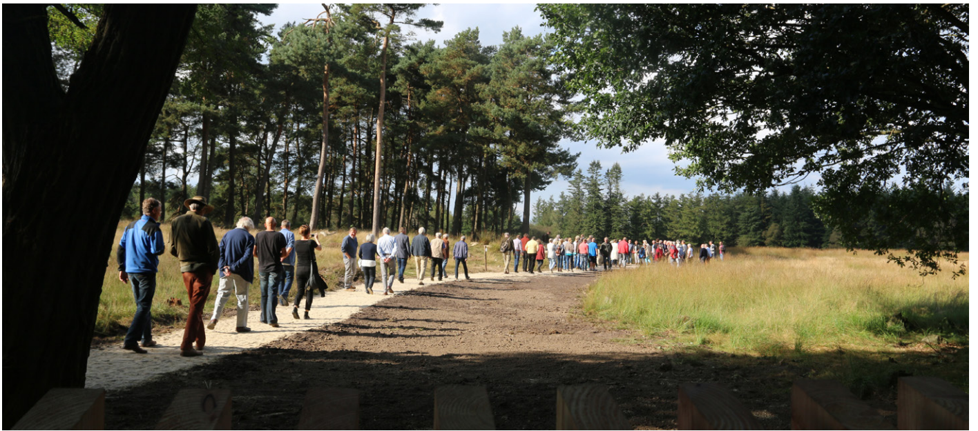
De opening van het monument in september 2016