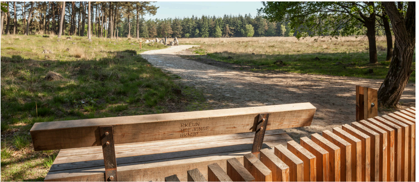
Nieuwe houten zitbank en hekwerk bij de toegang naar het monument.