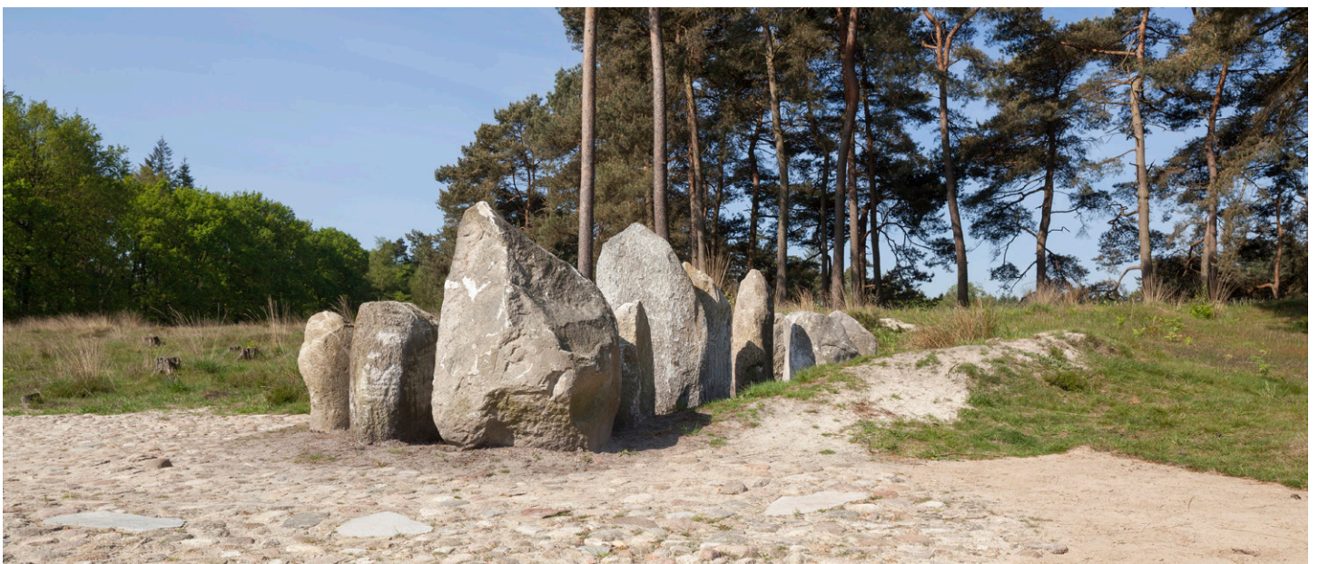
In de ingang van het hol staan 13 mens-grote veldkeien, die de 13 omgekomen mensen symboliseren.