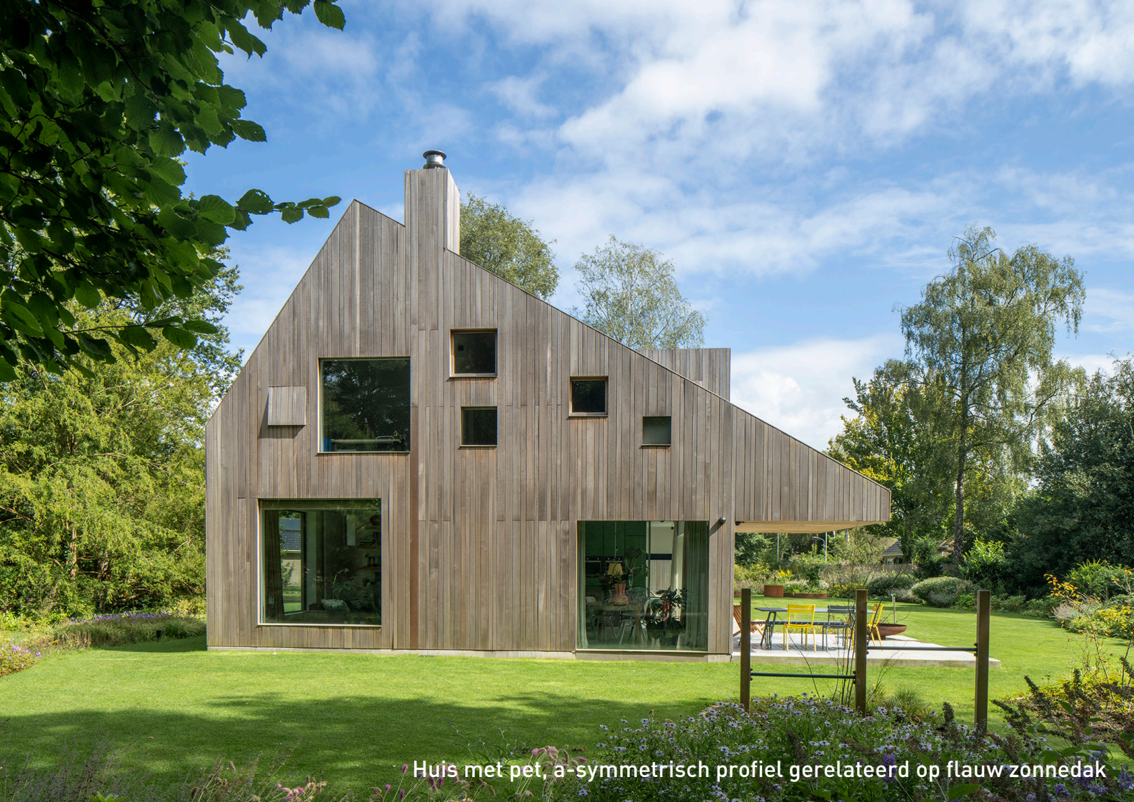
Huis met pet, a-symmetrisch profiel gerelateerd op flauw zonnedak