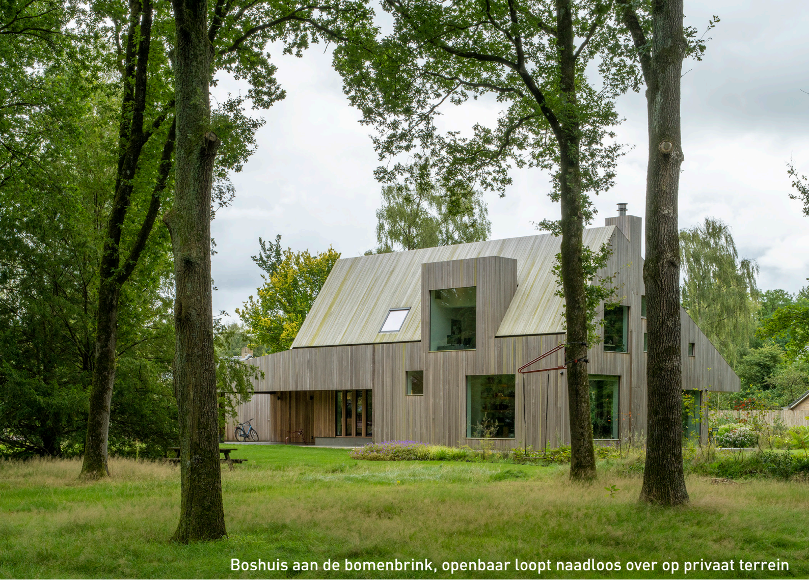
Boshuis aan de bomenbrink, openbaar loopt naadloos over op privaat terrein