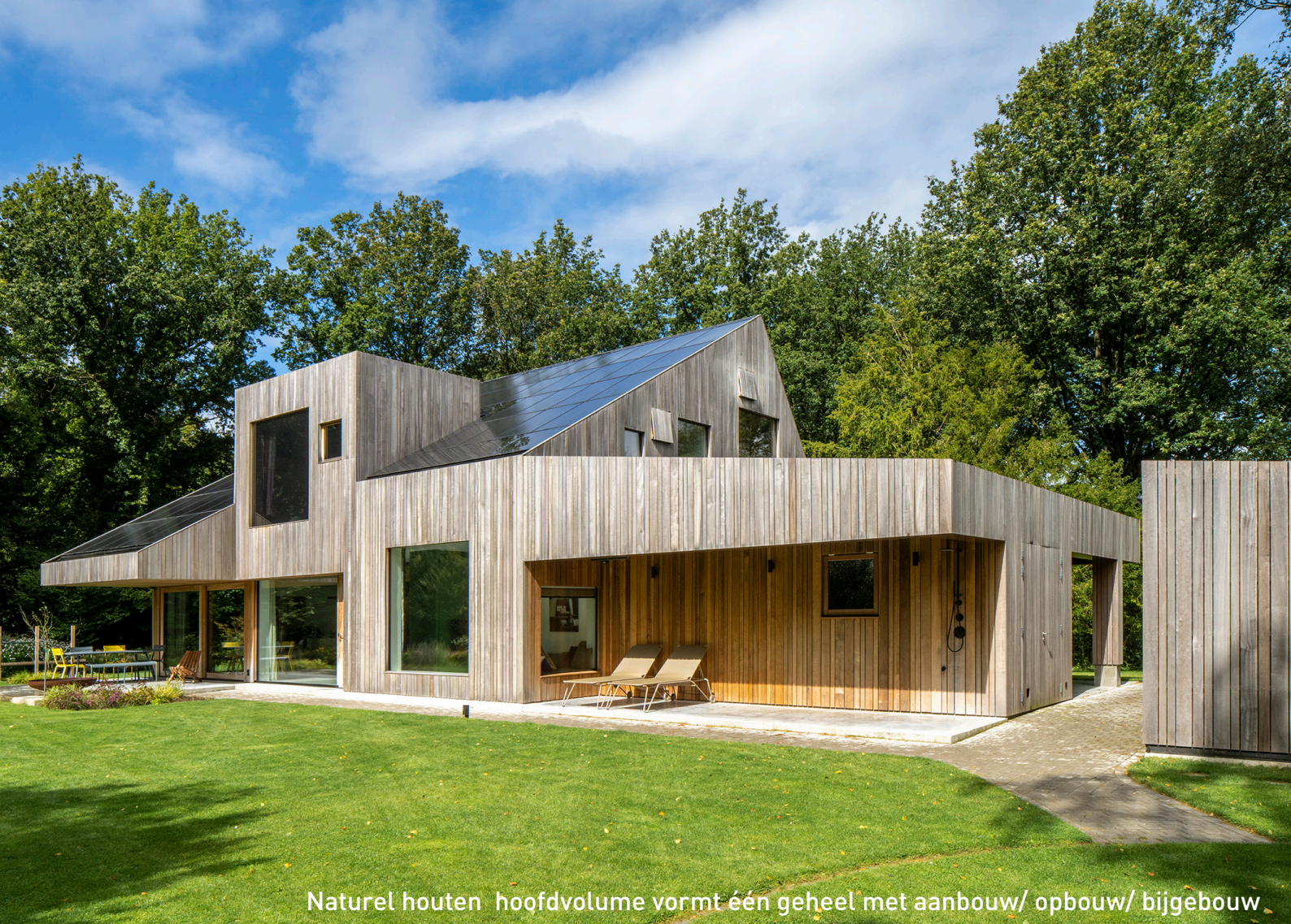
Natuurlijk houten hoofdvolume vormt één geheel met aanbouw/ opbouw/ bijgebouw