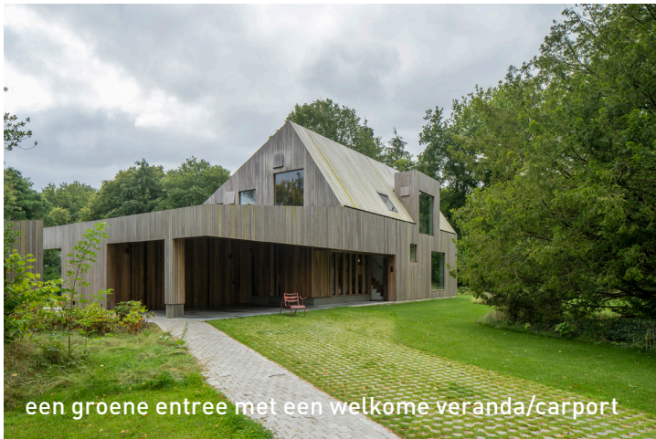
een groene entree met een welkome veranda/carport