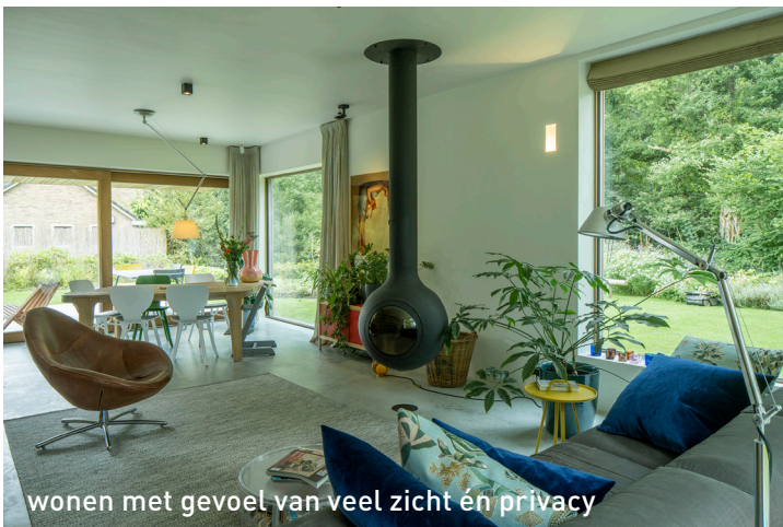
wonen met gevoel van veel zicht en privacy