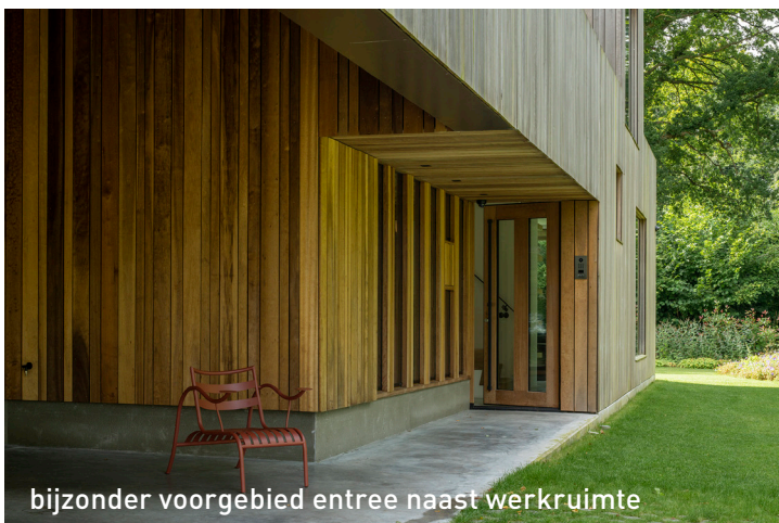
bijzonder voorgebied entree naast werkruimte